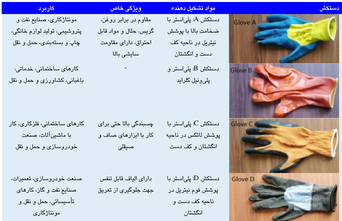
جدول ۱. ویژگی دستکش‌های حفاظتی مورد استفاده